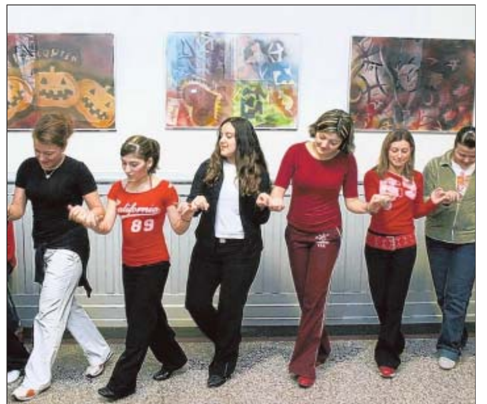
Schüler der Klassen 9a und 9b der Kepler-Schule gestalten die Vernissage mit Musik und Tanz.