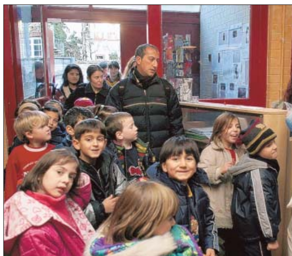
Melodien voller Mystik und mitreißenden Rhythmen verzaubert die kleinen Besucher im Theaterhaus TiG 7.