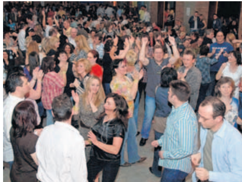
Volles Kulturhaus meldeten einmal mehr die Löwenjäger. Der Saal war bei der achten Schlagerparty wieder restlos ausverkauft.